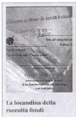
La locandina della raccolta fondi

E le donne che muoiono di parto in Senegal? Per loro è in programma, sabato 12, alle ore 19 presso l'Auditorium del Liceo Scientifico «Severi», di Castellammare una festa del cioccolato solidale che offrirà deliziose prelibatezze (sarà anche presente uno stand con prodotti gluten-free per celiaci), e darà la possibilità di aiutare la Ong nei suoi progetti. La vendita del commercio equo e solidale farà da cornice alle danze orientali del centro culturale «Claudia Soheir». In questo modo si raccoglieranno altri fondi per gli interventi in Senegal a cominciare dalla costruzione di una sala parto a Mbor. Questa festa non sarà l'unica. In programma ci sono cene, spettacoli e altri interventi per arrivare a dare anche in quella zona dell'Africa strutture idonee alla assistenza sanitaria.